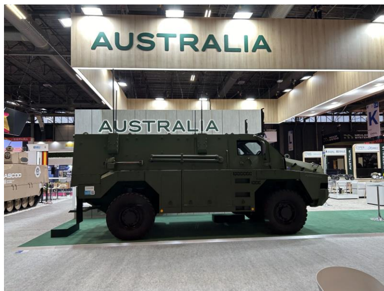
přibližná představa – Bushmaster